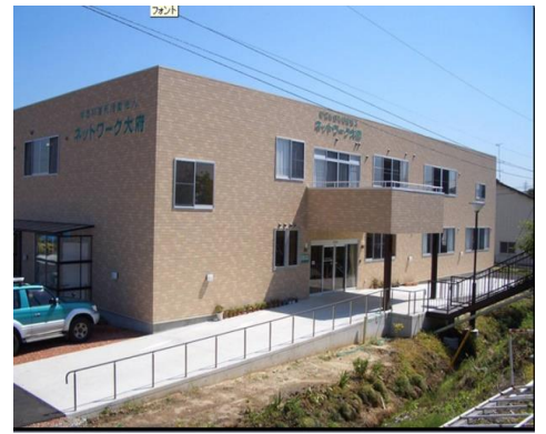
ネットワーク大府 本部

平成19年3月にオープンしました多機能ホーム「いしがせ」は、誰しも長年住み慣れた自宅で最後まで生活し続けたいとの思いを抱いて、その思いを実現するため『泊まって、通って、訪問して』という3種類のサービスを柔軟に組み合わせ一体でサービスを提供することにより在宅生活を支えています。