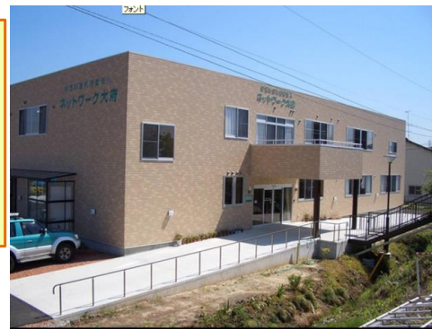
ネットワーク大府 本部

家庭的な雰囲気が好評なディサービスです。寛ぎと暖かい親密な安らぎを感じていただけることでしょう。地域に密着したネットワーク大府ならではのたくさんのボランティア、慰問やスタッフによる季節に応じた多彩なレクリエーションの催し等に楽しい時をお過ごし下さい。